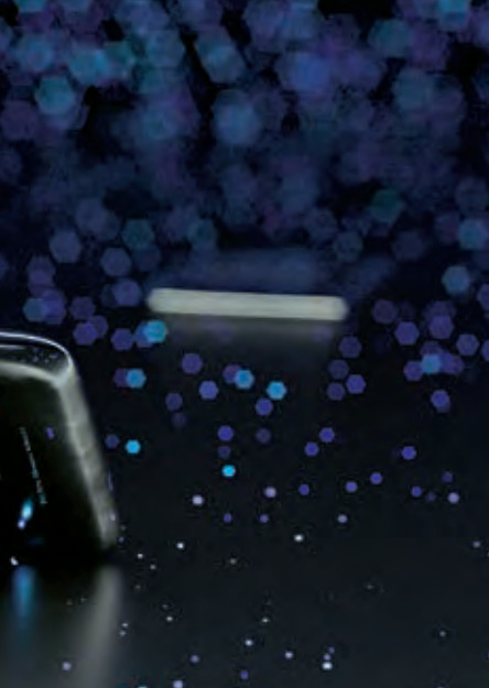
PLATINBARREN: Das Edelmetall besitzt Potenzial